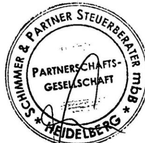
Steffen Schulz-von Engeln Dipl.-Kfm Steuerberater